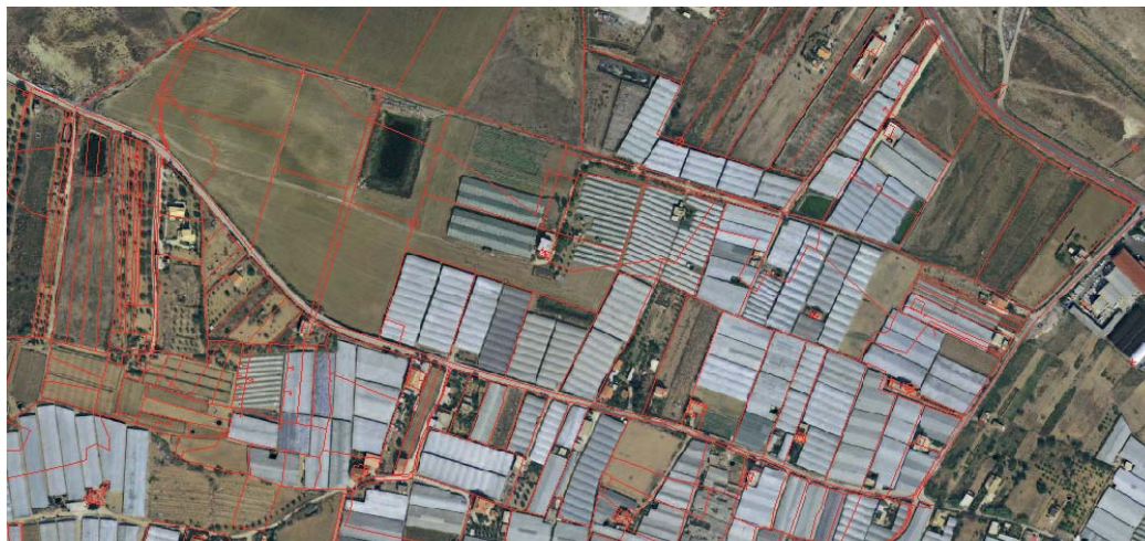
Fig. 2 – Esempio di applicazione del grigliato NTV2 relativo al Comune di Licata (AG)

sto rispetto agli strati cartografici del Portale Cartografico Nazionale (PCN), ottenendo risultati più che soddisfacenti, come mostrato ad esempio in Fig. 2.