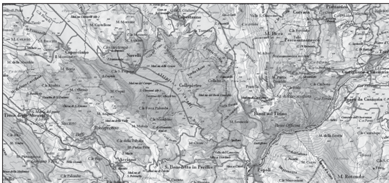
Fig. 3 Particolare della Carta delle Aree percorse da Incendi, anno 2007

Inoltre è stata realizzata una Carta delle Aree Percorse da Incendi, anno 2007, utilizzando come base il DB Topografico 1:100.000 della Regione Abruzzo sul quale sono stati caricati i perimetri digitalizzati manualmente relativi ad ogni evento (in Fig. 3 ne è riportato un particolare), la Carta è inoltre corredata dalle corrispondenti tabelle derivanti dall'intersezione dell'Uso del Suolo.