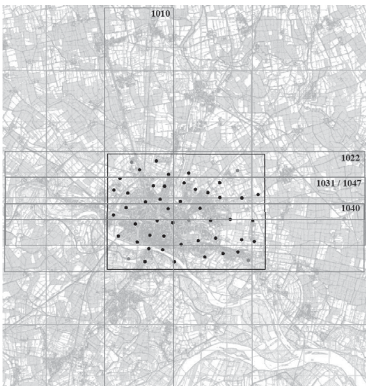
Figura 1. Struttura del blocco a 2000 m e distribuzione dei punti di appoggio

Il blocco a 2000 m, usato per la stima dell'accuratezza geometrica, è costituito da quattro strisciate Est-Ovest e da una strisciata Nord-Sud, indicate in Figura 1; le strisciate 1031 e 1047 hanno la stessa impronta a terra, ma sono state acquisite con direzioni di volo opposte. Il test-site di Pavia dispone, tra gli altri elementi, di 50 punti di controllo artificiali, aventi lato di 60 cm, creati per la ricerca su ADS40; la disposizione di tali vertici è riportata anch'essa in Figura 1. La triangolazione