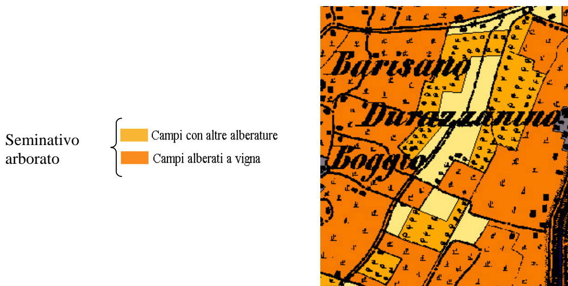
Fig. 3 – Esempio dei due simboli presenti per indicare la classe del Seminativo arborato

Rispetto alle categorie CLC si sono rese necessarie alcune variazioni dovute al grande lasso di tempo intercorso tra il periodo storico considerato e quello in cui sono nate le specifiche del progetto europeo. In particolare alla metà dell'ottocento il paesaggio emiliano-romagnolo di pianura era caratterizzato soprattutto dalla piantata padana che alternava le colture a seminativo a filari di vigna con tutore vivo e ad altre alberature. Si è così introdotta una classe per i seminativi arborati, che le specifiche Corine non contemplano, poichè questo tipo di governo del territorio è andato via via scomparendo con la meccanizzazione, fino a non essere quasi più presente. Il dettaglio del rilievo del cartografo militare ha permesso di distinguere due categorie di seminativo arborato attraverso due tipi di simboli. Uno indica la presenza della vite "maritata" ad alberature che fungevano da sostegno vivo, l'altro indica la presenza di filari di alberi alternati a colture, ma senza vite; nella figura sottostante sono evidenti i due tipi di simboli utilizzati.