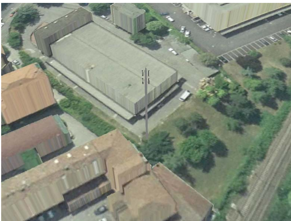
Figura 2 – Inserimento di una Stazione Radio Base nel modello tridimensionale della città

Il gestore, nella documentazione da allegare alla domanda di autorizzazione è tenuto ad inserire piante e prospetti, in scala opportuna, con indicate anche le direzioni di puntamento delle celle permettendone l'inserimento nel sistema 3D.