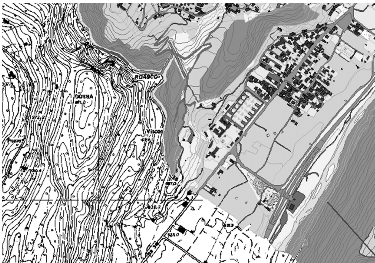
Figura 1 – Esempio di integrazione fra il DB 2000, il DB 10000 e la vecchia CTR

Il principio che è sempre stato rispettato è di non replicare il dato contenuto nei DB topografici alle scale 1:2000 e 1:10000 ma di utilizzarlo direttamente per tutte quelle istanze che sono mutevoli sul territorio. In tal modo gli aggiornamenti che interverranno dei DB topografici potranno essere interrogati dal WebGIS e le modificazioni appariranno nelle future edizioni delle carte escursionistiche. Si è invece lavorato su alcune istanze più stabili nel tempo (teoricamente invariabili) in modo da ottimizzarle per il DB al 25000 e per generare i prodotti parziali necessari (DTM, sfumo orografico, ecc..).