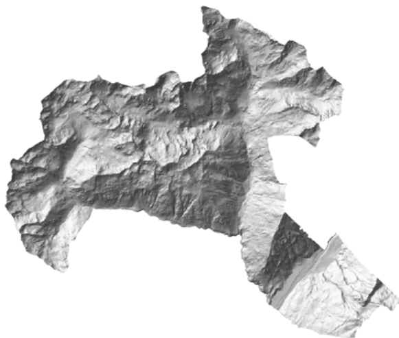
Figura 2 – Il DTM della Val Grosina

Il DTM è sostanzialmente derivato dalle informazioni dei DB topografici e la sua generazione avviene dunque in modo diretto ed automatizzato. Partendo dagli shape delle entità "curve di livello", che costituiscono l'elemento essenziale per definire l'orografia del territorio, e da altre informazioni morfologiche quali i corsi d'acqua, la viabilità, i dislivelli ed i punti quotati, è stato sufficiente settare una serie di parametri, geometrici e grafici, per arrivare alla costruzione strutturata di un modello tridimensionale sufficientemente attendibile.