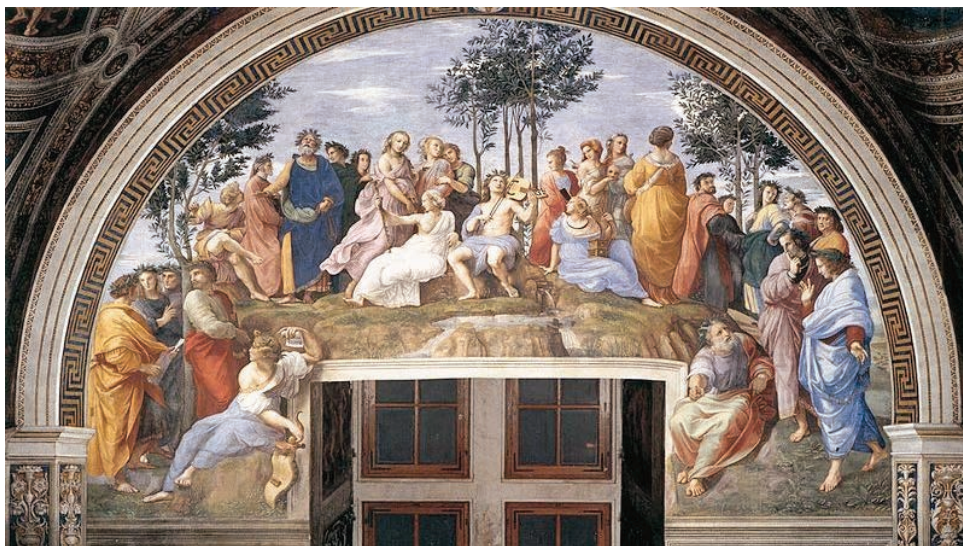
Raffaello Sanzio, Parnaso (Musei Vaticani, Città del Vaticano)

Il grande ruolo della cultura e specialmente di quella classica ... non è raffinatezza antiquaria, bensì, insieme alla Bibbia, fondamento della nostra civiltà e intelligenza dell'umano, nient'affatto contrapposta ai saperi scientifici che mutano il mondo e la visione del mondo ma capace di guardarli senza paura e senza idolatrie e di dar loro un senso. Questa cultura, basata sulla terribile sapienza greca e sull'insuperabile arte di governo dell'antica Roma oltre che sulla Bibbia, non si oppone ad alcun più modesto ma autentico sapere di chi non ha avuto possibilità di dedicarsi a profondi studi, bensì a quella che ... chiamano ... letteralmente "mezza cultura", sarebbe meglio dire mezza calzetta, pretestuosa e pacchiana, che spesso trionfa nel teatrino pseudointellettuale (Claudio Magris, Un sogno ad occhi ben aperti ).