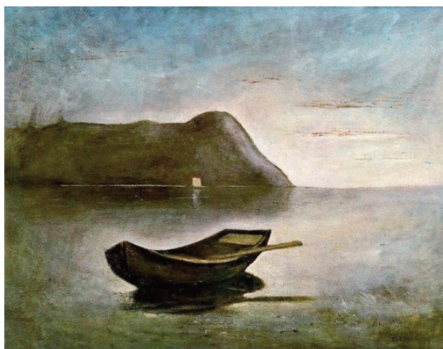
Carlo Carrà, Sera sul lago – Barca solitaria (collezione privata)