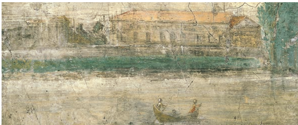
Camera di Ovidio – Fregio delle Metamorfosi (Palazzo Te, Mantova)

Fondamentale è lo stile ironico, critico ed erotico che Ovidio profonde nelle sue opere, per prendere in considerazioni dettagli piccolissimi, così come dimensioni grandissime, unitamente alle cose normali della vita comune e/o delle meraviglie della natura. In questo modo, pur essendo e restando un uomo della sua epoca, Ovidio è capace di suscitare pensieri, sensazioni ed immagini che sono proprie anche di tempi ben più prossimi ed addirittura contemporanei.