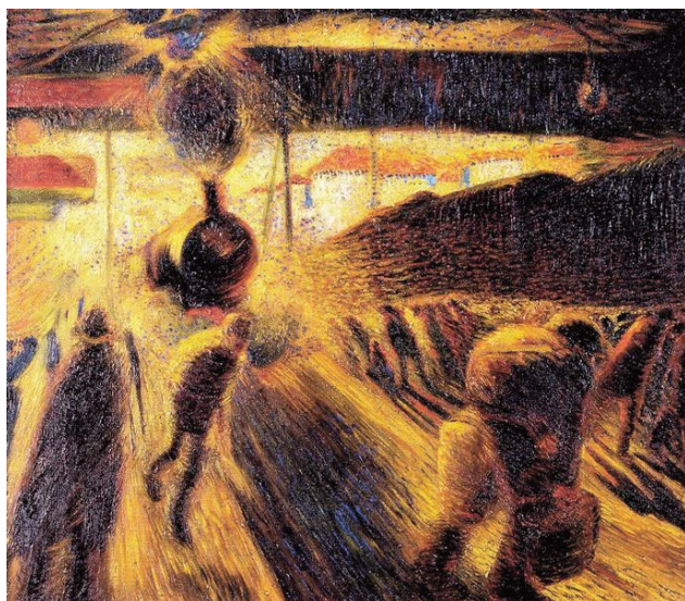
Carlo Carrà, La stazione di Milano (collezione privata)

Nel prosieguito, si forniscono le chiavi di lettura di una elaborazione dei miti, narrati in Le Metamorfosi di Ovidio, volta a costruire un particolare Sistema Informativo Mitologico, a partire da quanto noto ed in uso per i Sistemi Informativi Geografici (nell’acronimo inglese: GIS), ed insieme ad allargare i confini delle Applicazioni Geomatiche che si avvalorano di questo mezzo, tra altri in loro possesso. Di conseguenza, la prima lista contiene un elenco dei personaggi, qualche luogo e qualche altro elemento, affiancato ad una numerazione che segue l’ordine alfabetico di questo elenco. Invece la seconda tabella riporta questa numerazione, giustapposta all’elenco originale dei miti, narrati in Le Metamorfosi.