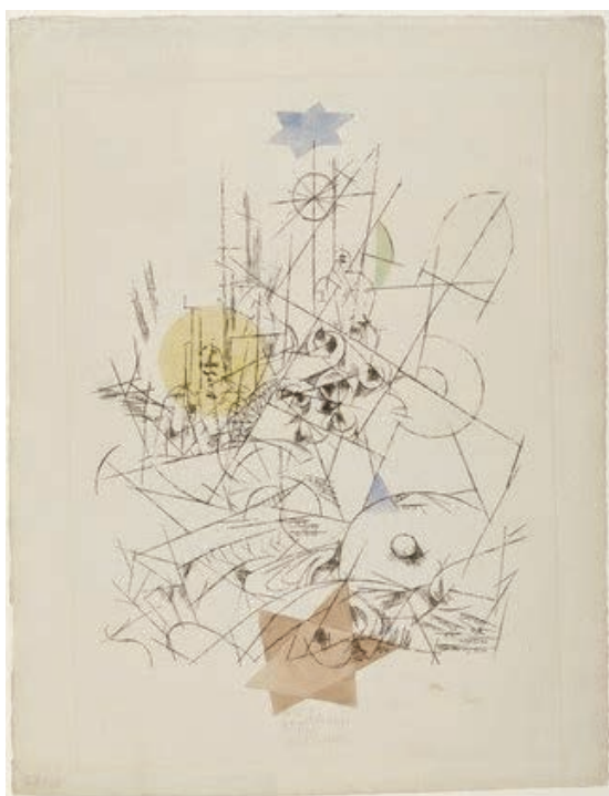
Paul Klee 14 , Distruzione e speranza (National Gallery of Art di Washington DC)

Una nota stilistica rilevante è poi presente nella figura di Corinna cui Ovidio si rivolge nelle sue opere. Infatti Corinna non è una delle mogli, né sua figlia o la figlia della sua terza moglie, a fortiori, ma la figura ideale di una donna-amante, quasi una musa ispiratrice, come Beatrice per Dante, Laura per il Petrarca (per quanto Laura sia realmente esistita; del resto, anche Beatrice è esistita, ma è morta ancora giovane), Fiammetta per Boccaccio, ecc., con la quale vivere in un mondo proprio.