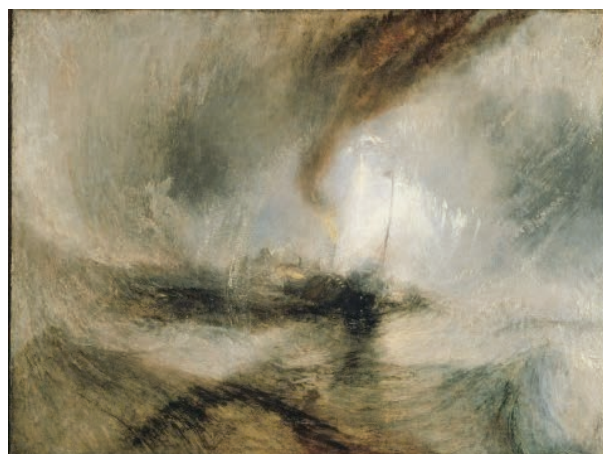
William Turner, Light and Color 10 – Goethe's Theory 11 (Tate Gallery, London)