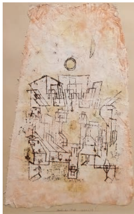
Paul Klee, Città araba (Original color lithograph)

Una caratteristica generale, delle opere di Ovidio, è la trasposizione dalla geografia dei luoghi civili e dalla natura politica delle istituzioni (già repubblicane e proprio allora divenute imperiali), ai luoghi destinati all'amore ed alla topografia dei corpi dei soggetti partecipanti agli amori. Tuttavia il