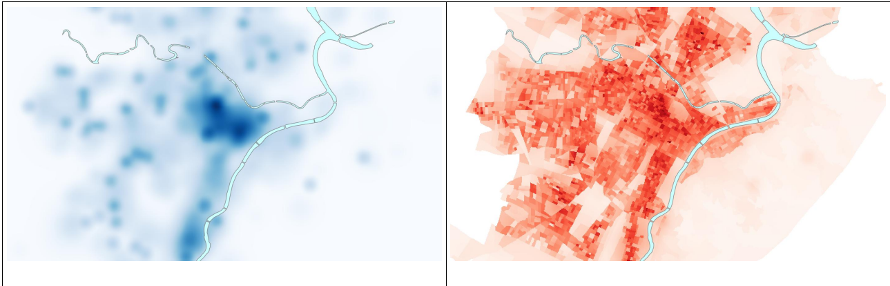
Figura 1 – A destra, somma pesata delle KDE relative alle attività attrattive elencate in tabella1. A sinistra, in rosso più intenso le parti della città più adatte allo sviluppo della walkability

I macro-indici sono il risultato della somma pesata di un certo numero di indici. Per renderli confrontabili e sommabili macro-indici e indici sono stati prima normalizzati su una scala 0-100. Per tutte le elaborazioni, a livello città e al livello neighborhood , è stato utilizzato il SW GIS QGIS (ver. 3.2).