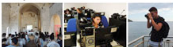
LICEO CLASSICO PARMENIDE VALLO DELLA LUCANIA ALTERNANZA SCUOLA LAVORO "PARMENIDE A SCUOLA DI TERRITORIO"

www.inventati.org/aus/ www.golfodamare.it